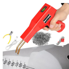
SOLDADORA DE PLASTICO 200