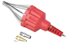
ESPACIADOR DE BOTAS NEUMATICO