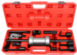
EXTRACTOR DE ABOLLADURAS DE MARTILLO DESLIZANTE PRECIO: 65.00