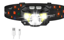
LÁMPARA DE CABEZA PRECIO: 12.00