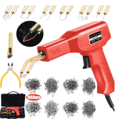
SOLDADORA DE PLASTICO 50 WATTS