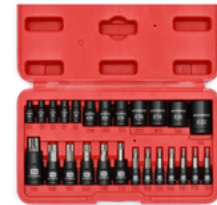
JUEGO DE 25 PIEZAS JUEGO DE DADOS TORX PRECIO: 20.00