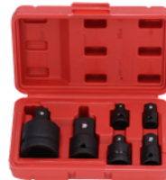
ADAPTADORES DE SOCKET