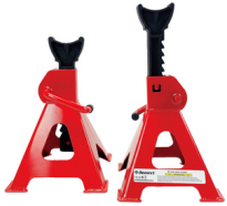
BURRO DE 3 TONELADAS PRECIO: 30.00