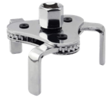
EXTRACTOR DE FILTRO DE ACEITE