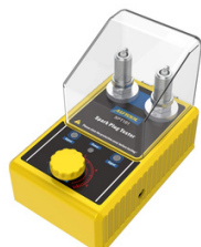
PROBADOR DE BUJÍAS PRECIO: 40.00