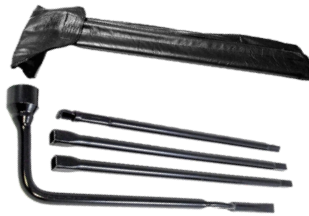
LLAVES PARA GATO DE TIJERA