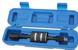
EXTRACTOR DE INYECTORES DIESEL CON MARTILLO DESLIZANTE