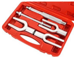
JUEGO DE SEPARADOR DE RÓTULAS