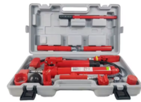
GATO HIDRÁULICO PARA CHAPISTERÍA 10 TON PRECIO: 180.00