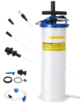
EXTRACTOR AL VACÍO DE FLUIDOS DE MOTOR, TRANSMISIÓN Y FRENO