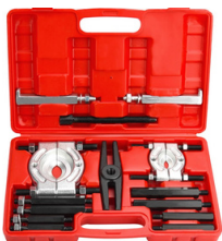
EXTRACTOR RODAMIENTO Y BALINERAS