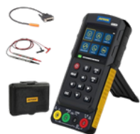
OSCILOSCOPIO MULTIMETRO DIGITAL PRECIO: 120.00