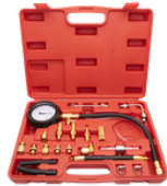
MEDIDOR DE PRESIÓN DE COMBUSTIBLE