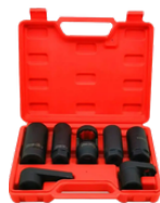
EXTRACTOR DE SENSOR DE OXÍGENO