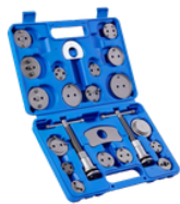
COMPRESOR DE DISCO DE FRENO Y CALIPER