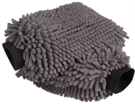
PAR DE GUANTES DE MICROFIBRA