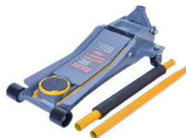
GATO HIDRÁULICO BAJO PERFIL 3 TONELADAS