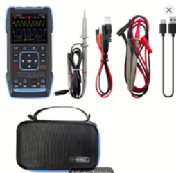
OSCILOSCOPIO DIGITAL DE DOS CANALES PRECIO: 120.00