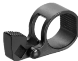
EXTRACTOR DE BARRA DE TERMINAL DE ACOPLAMIENTO Y TERMINAL DE DIRECCION