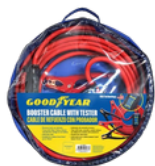
JUMPER CON PROBADOR PRECIO: 22.00