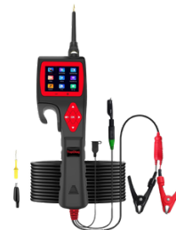
PROBADOR DE CIRCUITOS AUTOMOTRIZ P200