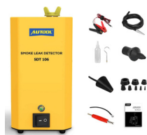
DETECTOR DE FUGA DE HUMO PRECIO: 150.00