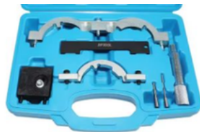
ALINEACION DE TIEMPO CHEVROLET AVEO OPEL CRUZE PRECIO: 35.00