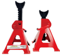
BURRO DE 6 TONELADAS PRECIO: 50.00