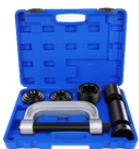
EXTRACTOR DE ROTULAS Y BUJES