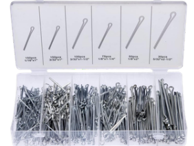
CLIPS PASADORES 555 PIEZAS DE ACERO DE RESORTE