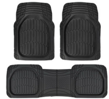
ALFROMBRAS DE GOMA PARA AUTOS