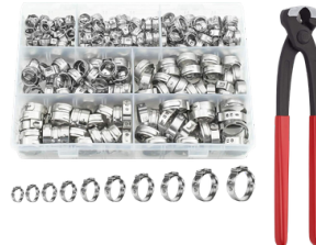
ALICATE 139 CON ABRAZADERAS DE MANGUERA