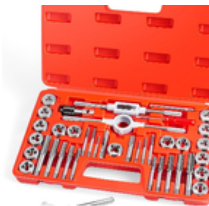
KIT PARA HACER ROSCAS MILIMÉTRICAS PRECIO: 35.00