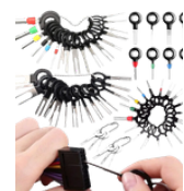
EXTRACTOR DE TERMINALES ELÉCTRICOS 36 PIEZAS