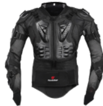
CHAQUETA DE MOTOCICLISTA