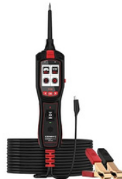
PROBADOR DE CIRCUITOS AUTOMOTRIZ P150