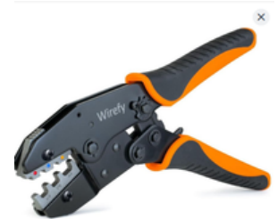
CRIMPADORA DE CONECTORES ELECTRICOS