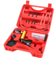
BOMBA DE PURGA DE FRENO