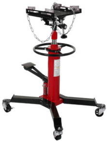
GATO PARA TRANSMISIÓN