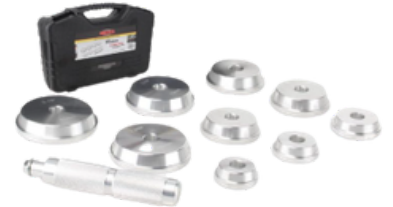
INSTALADOR EXTRACTOR DE RETENEDORES Y SELLOS