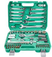
JUEGO DE LLAVES Y SOCKET 82 PIEZAS