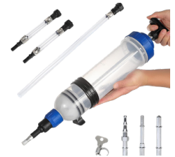
EXTRACTOR DE FLUIDOS AUTOMOTRIZ MANUAL 1.5 LITROS