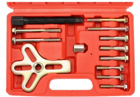
EXTRACTOR DE DAMPER DE VOLANTE