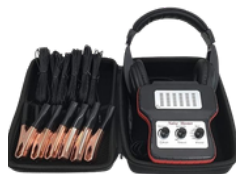
DETECTOR DE RUIDO DE MOTOR DE 6 CANALES PRECIO: 75.00