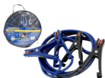
JUMPER 500 AMPERIOS PRECIO: 16.00