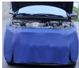
PROTECTOR MAGNÉTICO UNIVERSAL PARA MECANICA