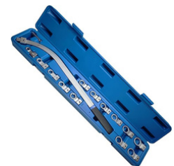
EXTRACTOR DE CORREA SERPENTINA PARA POLEA TENSORA