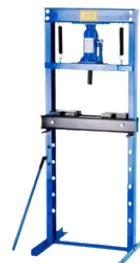
PRENSA HIDRAULICA DE BANCO 20 TONELADAS