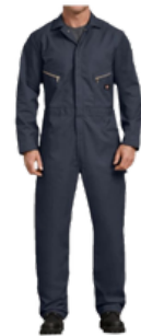
OVEROLES PARA MECANICA