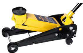
GATO HIDRÁULICO PARA TALLER 3 TONELADAS