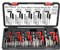
REPARADOR DE ROSCAS HELICOIDALES MÉTRICO