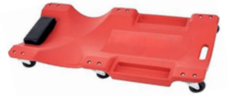
CAMILLA CON REPOSACABEZA ACOLCHADO