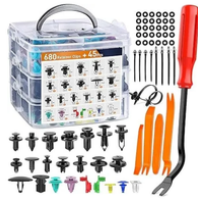
CAJA DE CLIPS DE RETENCION DE 680 PIEZAS