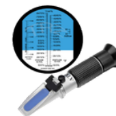
REFRACTÓMETRO DE REFRIGERANTE ANTICONGELANTE PRECIO: 18.00