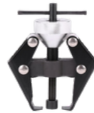
EXTRACTOR DE BRAZO DE LIMPIA PARABRIZAS Y TERMINAL DE BATERÍA