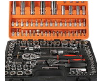
JUEGO DE SOCKET 108 PIEZAS 1/2 Y 1/4