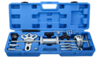
EXTRACTOR DE RODAMIENTO DE MARTILLO DESLIZANTE