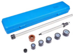
EXTRACTOR DE RODAMIENTO DE ÁRBOL DE LEVA