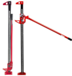
GATO PARA 4X4 DE 6 TONELADAS