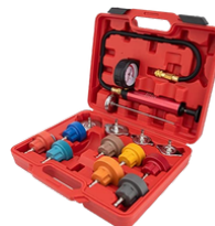
DETECTOR DE FUGA EN RADIADOR Y EMPAQUE