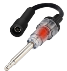
PROBADOR DE CHISPA