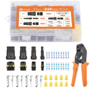
CRIMPADORA DE CONECTORES AUTOMOTRICES 349 PIEZAS