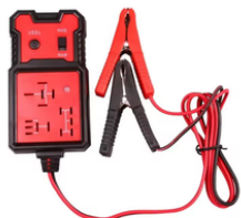
PROBADOR DE RELAY PRECIO: 16.00