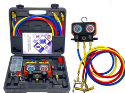
MANÓMETRO DE REFRIGERACIÓN