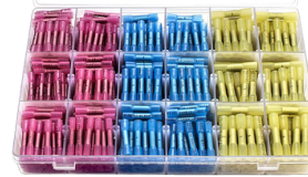
JUEGO DE 660 CONECTORES DE TERMINALES DE CABLES ELECTRICOS 25 TIPOS