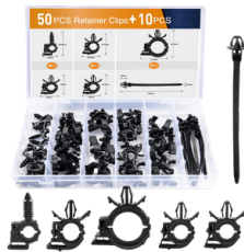
CLIPS PARA SUJETAR ARNESSES DE CABLEADO AUTOMOTRIZ