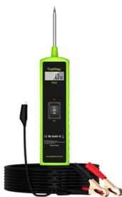
PROBADOR DE CIRCUITOS AUTOMOTRIZ P60