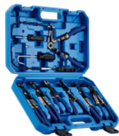
KIT DE ALICATES DE EXTRACCIÓN DE ABRAZADERA DE MANGUERA