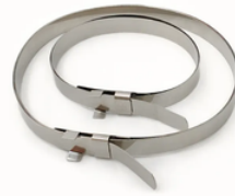
ABRAZADERAS DE BOTAS RV