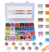
KIT SURTIDO DE 250 FUSIBLES PRECIO: 12.00