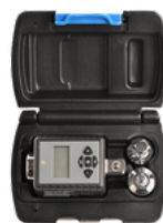
TORQUÍMETRO DIGITAL PRECIO: 50.00