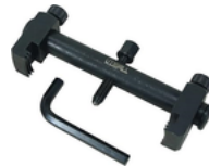
EXTRACTOR DE POLEA AJUSTABLE DE CIGÜEÑAL