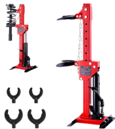
ESTACIÓN DE COMPRESIÓN DE AMORTIGUADORES HIDRÁULICO