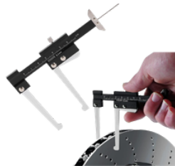
PINZA DE PROFUNDIDAD DE DISCO DE FRENO