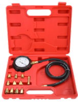
MEDIDOR DE PRESIÓN ACEITE