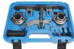
ALINEACION DE TIEMPO CHEVROLET ONIX TRACK PRECIO: 60.00