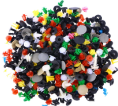
CLIP DE SUJERADORES 500 PIEZAS