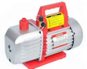
BOMBA DE VACÍO