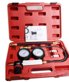
DETECTOR DE FUGAS DE CILINDRO Y TAPON DE MANIVELA