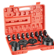
EXTRACTOR UNIVERSAL DE BALINERAS 23 PIEZAS