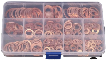
ARANDELAS DE COBRE 280 PIEZAS