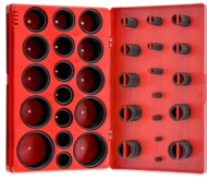
KIT DE 270 O-RING MILIMETRICO DE NITRILO PARA ALTA PRESION