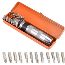
DESTORNILLADOR DE IMPACTO