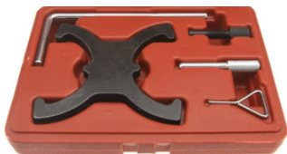
KIT DE ALINEACIÓN DE TIEMPO PARA FORD PRECIO: 30.00