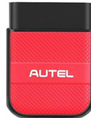
ESCANER OBDII AUTEL