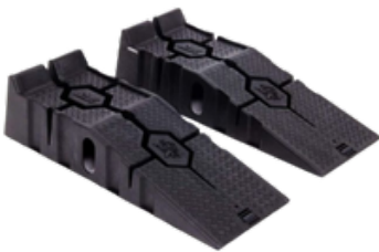
PAR DE RAMPAS DE 2.5 TONELADAS