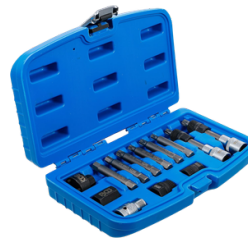
JUEGO DE MECHAS PARA SACAR POLEA DE ALTERNADOR