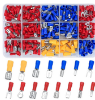
JUEGO DE 280 TERMINALES PARA CABLE PRECIO: 16.00