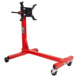
SOPORTE DE MOTOR 1000 LIBRAS