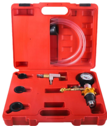
KIT DE PURGA AL VACÍO DE COOLANT