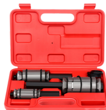
EXPANSOR DE MOFLE