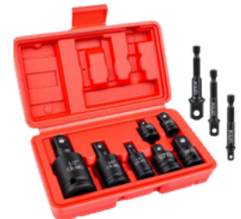
JUEGO DE ADAPTADORES MOVILES