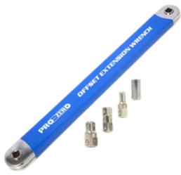
LLAVE DE EXTENSION DE 15 PULGADA