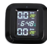
MEDIDOR DE PRESIÓN Y TEMPERATURA PARA MOTOS PRECIO: 22.00