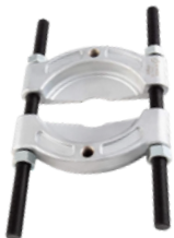
SEPARADOR DE RODAMIENTOS