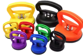
KIT DE VENTOSAS PARA REPARACIÓN DE ABOLLADURAS PRECIO: 20.00