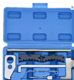
KIT DE ALINEACIÓN DE TIEMPO CHEVROLET FIAT ALFA ROMEO PRECIO: 30.00