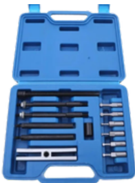
EXTRACTOR DE RODAMIENTOS DE INSERCION