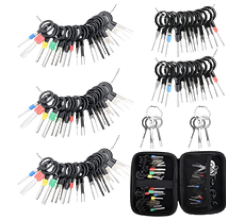
EXTRACTOR DE TERMINAL ELÉCTRICOS 100 PIEZAS