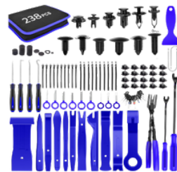
EXTRACTOR DE MOLDURA DE CLIPS DE RETENCIÓN