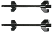
EXTRACTOR DE AMORTIGUADORES