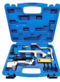
ALINEACION DE TIEMPO MINI COOPER BMW CITROEN PEUGEOT PRECIO: 35.00