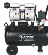
COMPRESOR DE 24 LITROS 0.75HP PRECIO: 150.00