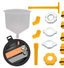
EMBUDO DE LLENADO DE REFRIGERANTE