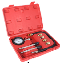
COMPRESÍMETRO DE MOTOR DE GASOLINA