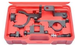
ALINEACION DE TIEMPO EXPLORER MUSTANG MAZDA LAND ROVER PRECIO: 60.00