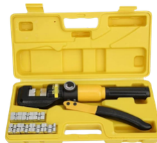
CRIMPADORA DE TERMINALES DE CABLES ELÉCTRICOS HIDRÁULICA