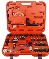
PROBADOR DE PRESIÓN DE RADIADOR Y RECARGA AL VACÍO 28 PIEZAS