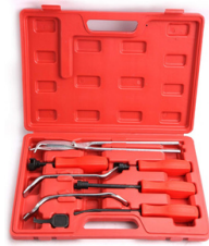
KIT DE HERRAMIENTAS DE FRENO DE TAMBOR