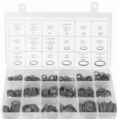
O RING MILIMÉTRICOS PARA REFRIGERACIÓN