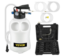
EXTRACTOR Y DISPENSADOR DE ACEITE DE TRANSMISIÓN