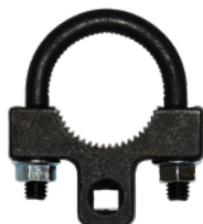
EXTRACTOR DE TERMINAL DE DIRECCIÓN