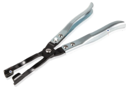
ALICATE PARA QUITAR SELLOS DE VALVULA