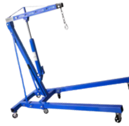
GATO HIDRAULICO PLEGABLE PARA MOTOR 2 TONELADAS