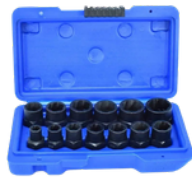
EXTRACTOR DE TUERCAS