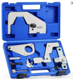
ALINEACION DE TIEMPO JAGUAR LAND ROVER FORD EVOQUE FOCUS PRECIO: 35.00