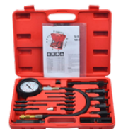
COMPRESÍMETRO DE MOTOR PARA AUTOS DIESEL