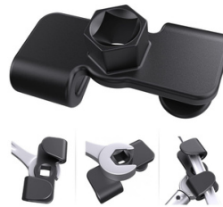
EXTENSOR PARA LLAVE INGLESA