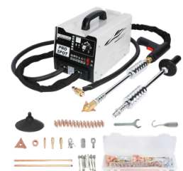
MÁQUINA REPARADORA DE ABOLLADURAS Y SOLDADOR DE PUNTOS