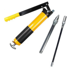
PISTOLA DE GRASA