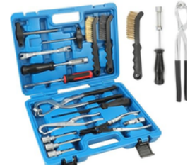
HERRAMIENTA DE FRENO DE TAMBOR Y LIMPIEZA