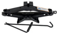
GATO DE TIJERA 3 TONELADAS