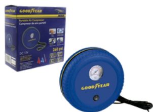
COMPRESOR DE AIRE PORTÁTIL GOODYEAR 12V PRECIO: 16.00